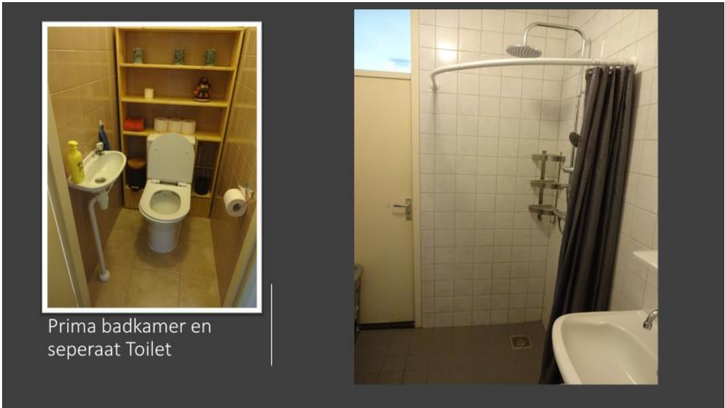
Prima badkamer en seperaat Toilet