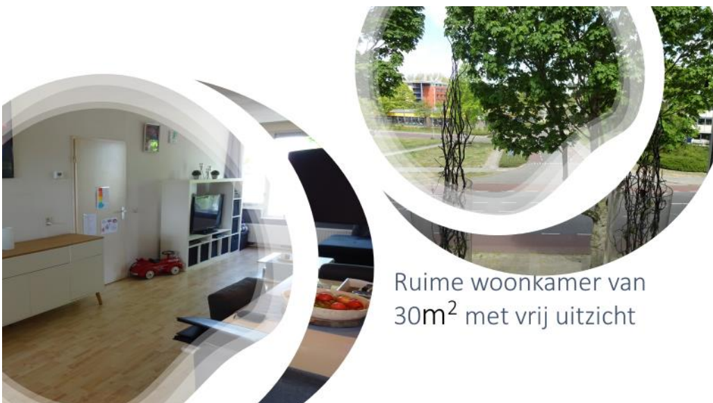
Ruime woonkamer van 30m 2 met vrij uitzicht